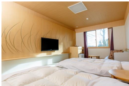
和室18㎡ツイン トイレ無