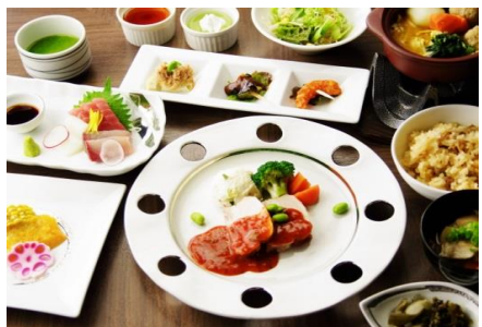
スタンダードのご夕食(イメージ)