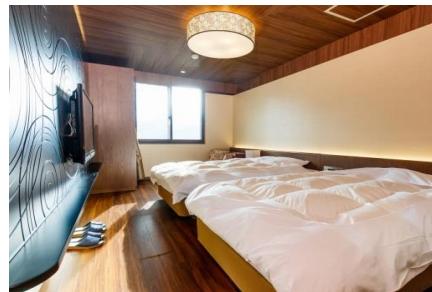
洋室18㎡ツイン バス・トイレ付