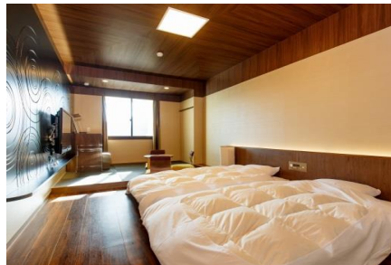
和洋室21㎡ツイン トイレ無