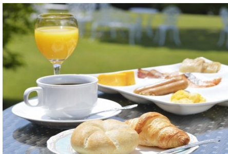
ご朝食 和洋buffet(イメージ)