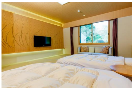
和室21㎡ツイン トイレ付